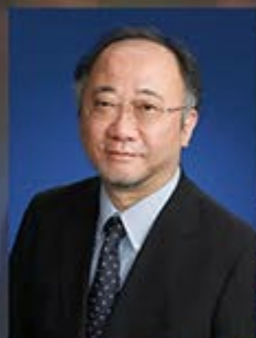
岡澤 均 教授