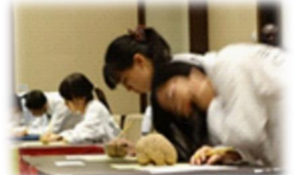
過去の世界大会の様子（集合写真（左）と本物の脳標本を用いたマクロ解剖セッション（右））