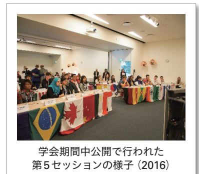
学会期間中公開で行われた第5セッションの様子(2016)